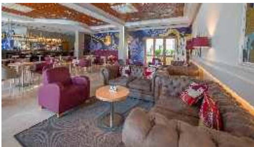
Bar La Habana

El Bar Ambigú cuenta con una programación diaria de espectáculos.