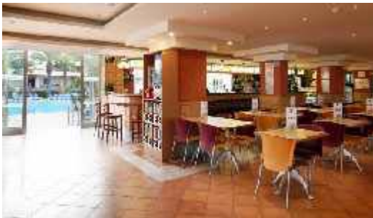
Snack Bar Torito

*Los horarios de servicio pueden variar según temporada